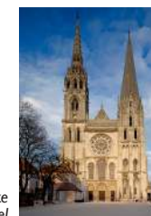
De westelijke gevel

Sinds de vierde eeuw, toen de eerste bisschop Adventinus vermeld werd, werd de kathedraal meermaals heropgebouwd. Na de brand van 1020 laat de invloedrijke bisschop Fulbert de romaanse kathedraal bouwen, waar men vanaf 1134 een nieuwe